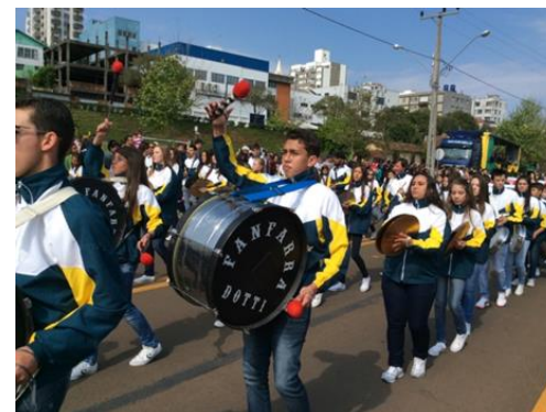
Disciplina e Respeito