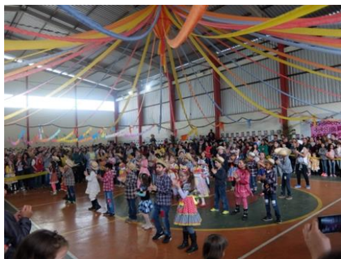
Ética e Estética