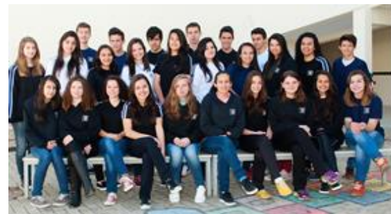
Alunos do matutino