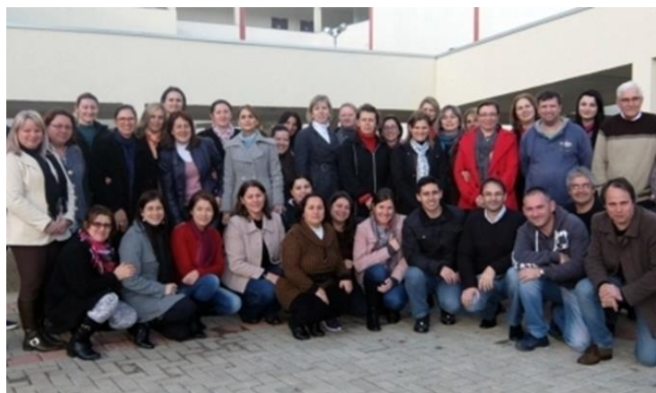
Professores e funcionários