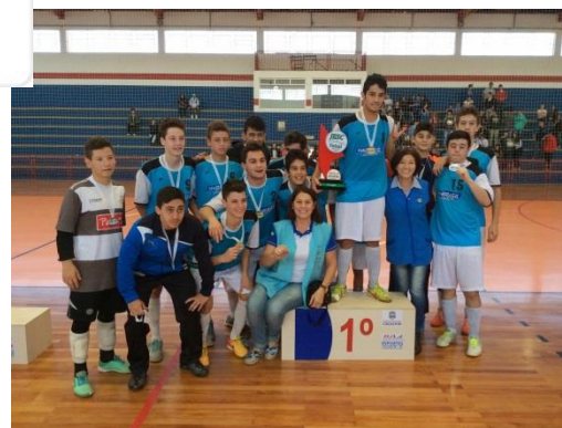
Humildade e Resiliência