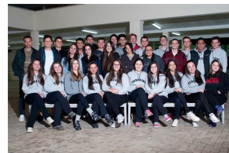
Alunos do noturno