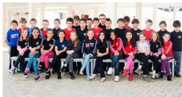
Alunos do vespertino